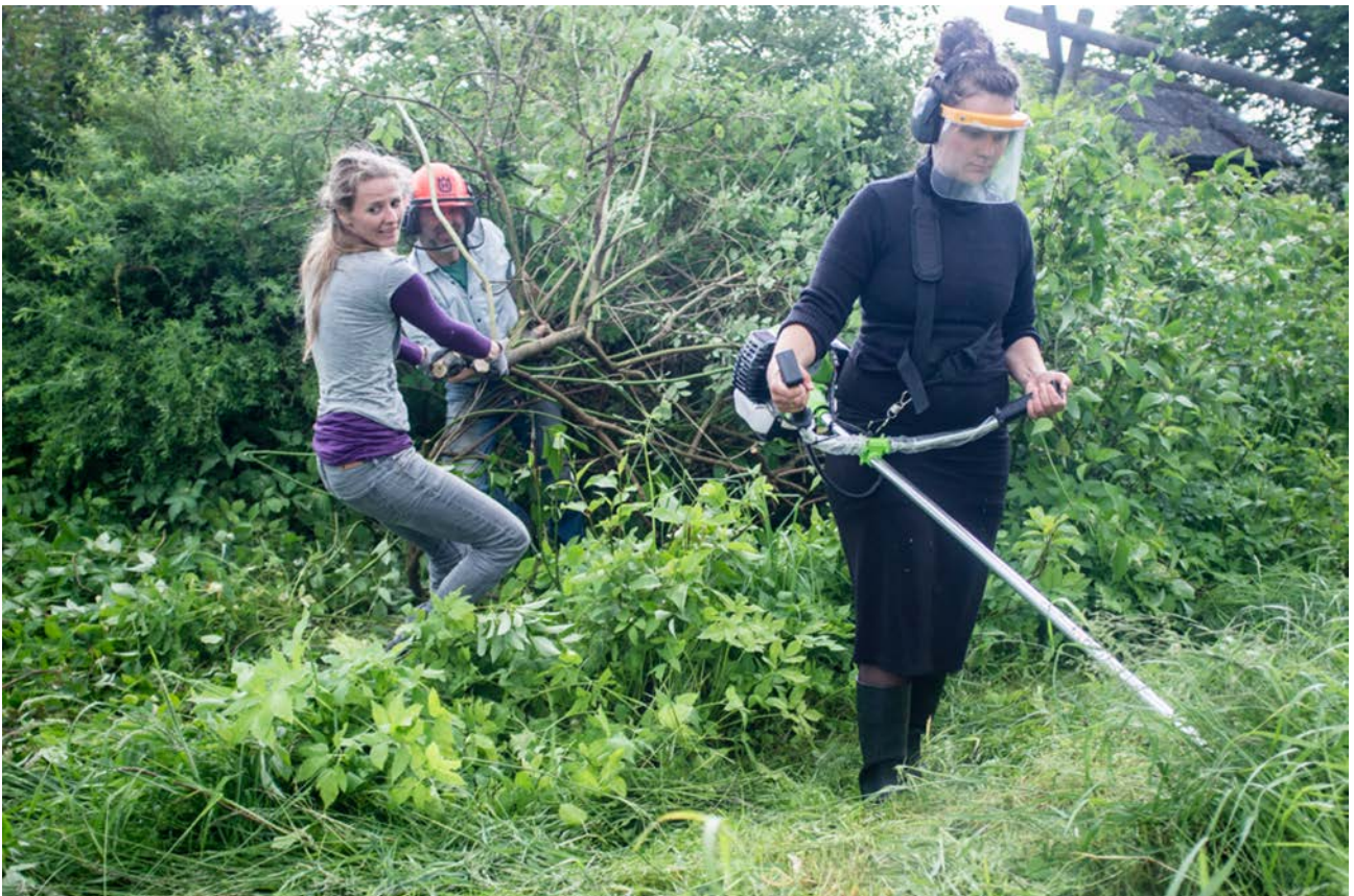
Fra frivilligdagen den 18. juni 2015, hvor Fællespladsen klargøres.